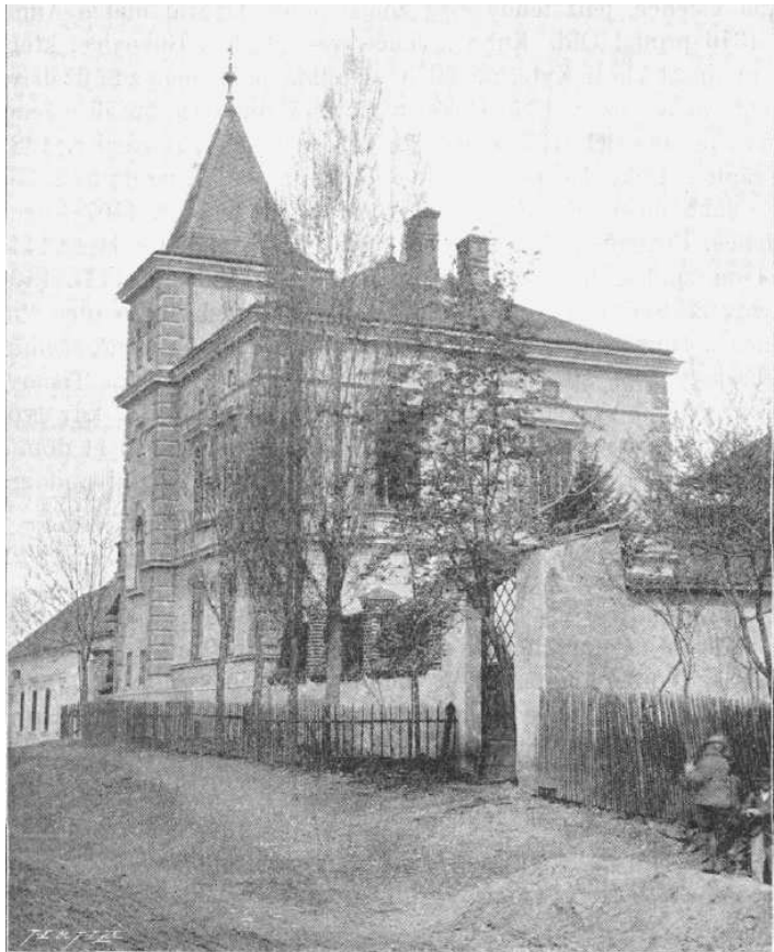
Nadační dům pro kněze z r. 1892 (dnes č.p. 49)