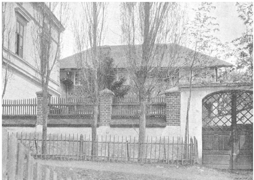
Nadační dům pro učitele (dnes č.p. 173), foto r. 1898