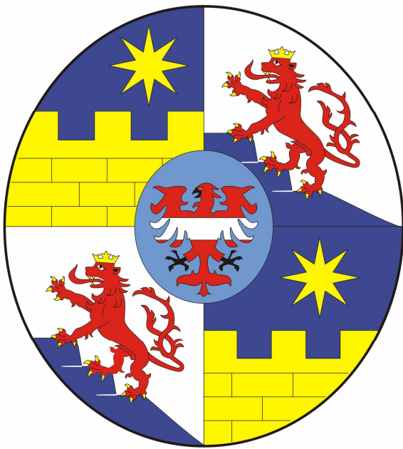
Erb hrabat z Rogendorfu, svobodných pánů z Mollenburgu